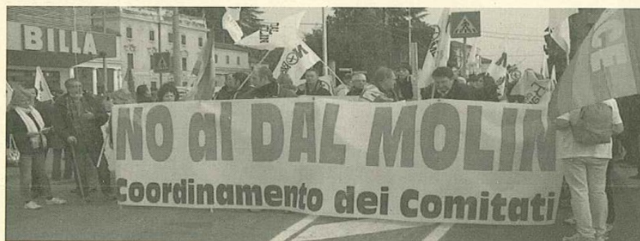
Foto di copertina: Vicenza 2 dicembre 2006, "No Dal Molin" manifestazione nazionale di protesta contro l'ampliamento della base Usa di Ederle. Le vignette che illustrano il numero sono tratte dal sito www.altravicenza.it

Guerre&Pace è stampata su carta riciclata