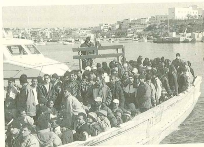
Barcone di migranti